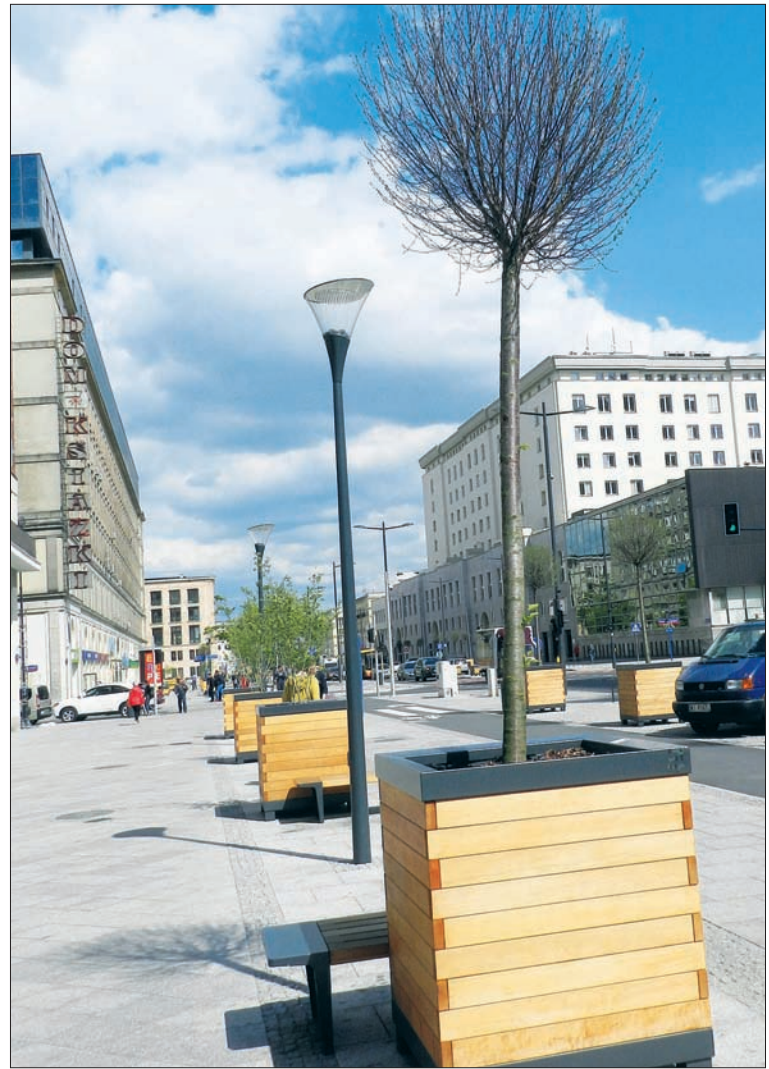
Doniczkowe rośliny po roku

Czy ktoś jeszcze panuje nad tym, co, gdzie i jak buduje się w naszej stolicy?