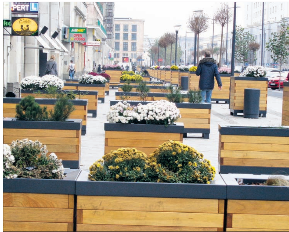
Skrzynki z kwiatami nazywane są tu potykaczami