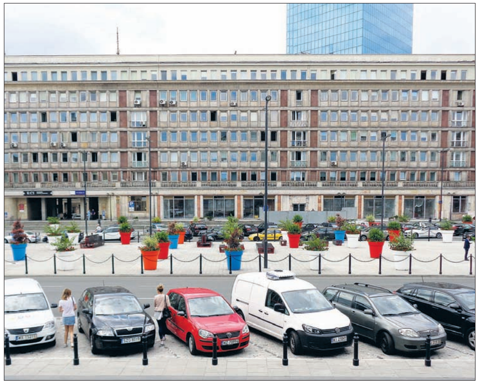
Plac Powstańców Warszawy po przebudowie